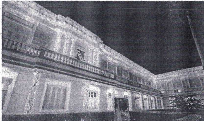
REITORIA da UFC com iluminação natalina

de 2023, quando as unidades receberam investimentos em R$ 6,2 bilhões.