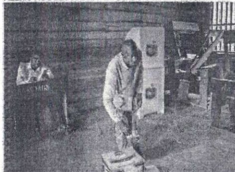
ELEIÇÃO na República Democrática do Congo é marcada por denúncias de fraude